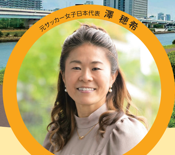
元サッカー女子日本代表 澤 穂希